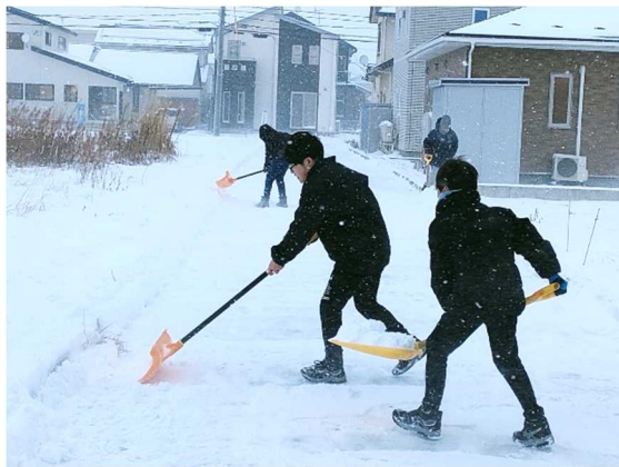
下校する後輩たちのために、吹雪の中、昼休みに通学路の雪かきをしてくれた6年生