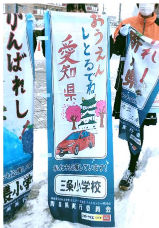
国体開始式で選手団を迎えた本校の子供たちが制作した歓迎ののぼり